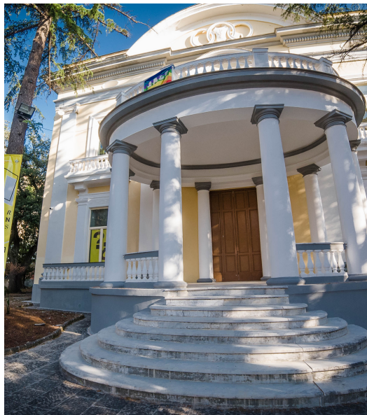
Villa Fernandes à Naples

La stratégie nationale italienne permet la (ré)utilisation des avoirs confisqués par les communautés. Cette approche remonte à 1996 lorsque Libera et d'autres ONG italiennes ont présenté un projet de loi au Parlement italien, introduisant le principe de (ré)utilisation des avoirs criminels confisqués à des fins sociales.